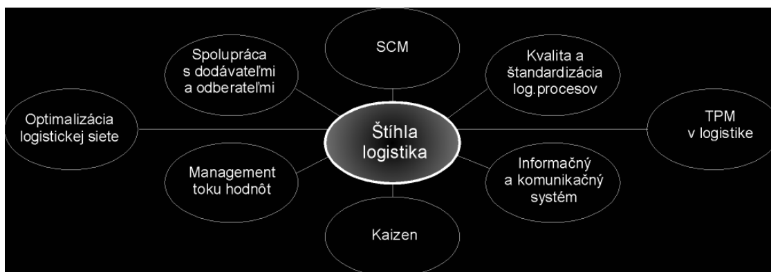
Obr. 2: Štíhla logistika [4,5]

Aby bolo možné pobiť sa s týmito čiastkovými problémami je potrebné zamerať sa na jednotlivé prvky, tvoriace filozofiu štíhlosti logistiky.